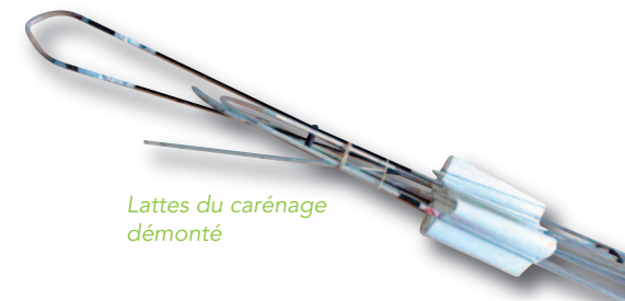
Lattes du carénage démonté